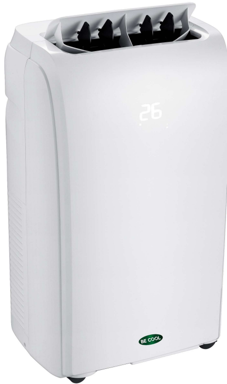
Umweltfreundliches und Ozonschicht schonendes Kältemittel R290.